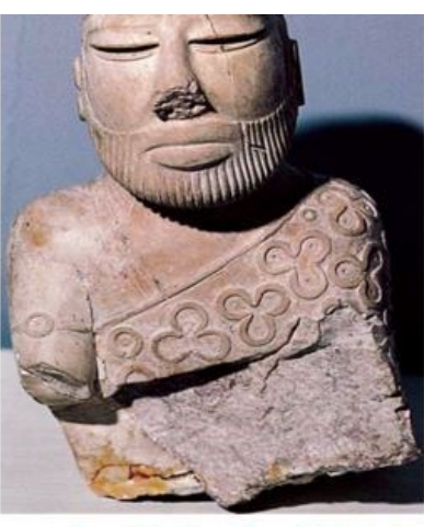
தாடியுடன் காட்சிதரும் கண்ணாம்புக்கல் சிலை