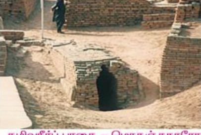
கழிவுநீர்ப் பாதை - மொகஞ்சதாரோ

வீடுகளின் வாயில்கள், உள் முற்றங்களிலோ, சிறிய தெருக்களிலோதான் அமைக்கப்பட்டன.