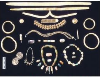
ஹரப்பாவில் கிடைத்த அணிகலன்கள்

கைத்தொழில் - எழுத்து பணி , முத்திரை செய்வோர், கட்டிட பணி மர சாமான் செய்வோர்