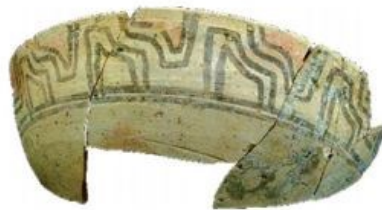
ஹரப்பாவில் கண்டெடுக்கப்பட்ட உடைந்த மண்பாண்டங்கள்

4. `நாட்டிய மங்கை` என்ற வெண்கல உருவ பொம்மை எங்கு கண்டு எடுக்கப்பட்டது?